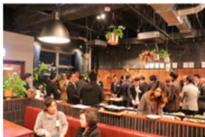
▲人脈づくりに役立つ交流会