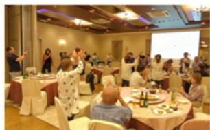
▲部会員同士の交流を深める事業