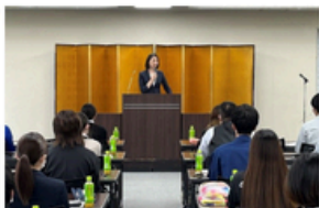
▲従業員のスキルアップ講座