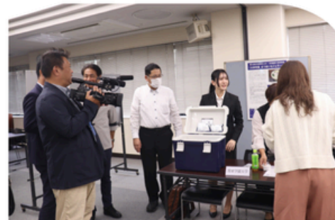
ビジネスプレス発表会