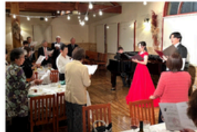
▲文化や芸術に触れるイベント