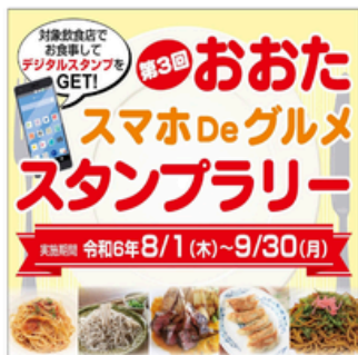
おおたスマホDeグルメスタンプラリー