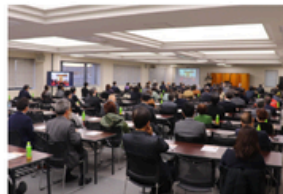
▲通年実施している各種講演会