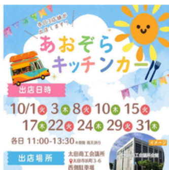
あおぞらキッチンカー

太田駅周辺の飲食店を“はしご”してもらうことを目的に、1セット3枚綴り3,300円のチケットを販売し対象店でチケットを1枚使用すると、ワンドリンク+ワンフォードのセットメニュー（はしご酒メニュー）を味わうことができるイベントを初開催。全会員より募集しました。当所HP・Instagramにて参加店舗のご紹介も。