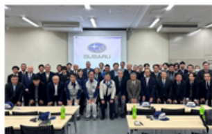
▲先進地視察研修会

業種ごとに6つの部会に分かれ、それぞれ事業を行っています。 ■各種講演会・セミナー（経営セミナー、ビジネスマナー研修等） ■視察事業や施設見学会（企業・工場見学、県内外の先進地視察等） ■部会員同士の各種交流会（ビジネスチャンス交流会、懇親会等）