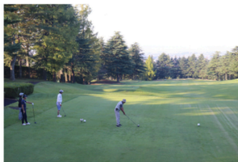
会員親睦チャリティーゴルフ大会