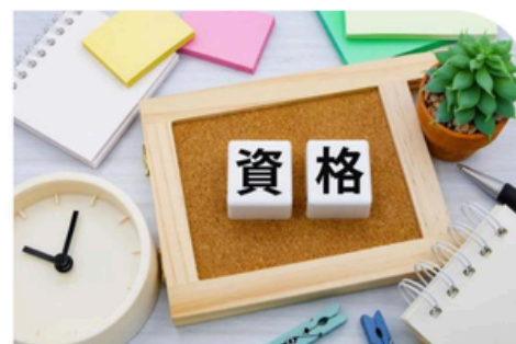
商工会議所検定試験