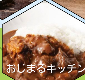
おじまるキッチン